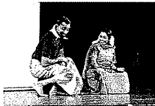
නාන් කාදලී - මාත් ආදරෙයි.....