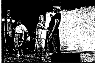
මොකටද කාසි බාගේ .....