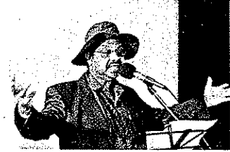
පින් මාලු වලේ .....

එදා 2009 ජූනි 19 වන සිකුරාදා සවස් භාගයේ, නෝන් රොක්ස්හි ඩොන්මුවර් ප්‍රජා ශාලාවේ පැවති, සිංහල සංස්කෘතික හමුව මගින් පළමුවරට සංවිධානය කොට ඉදිරිපත් කළ, විනෝද රාත්‍රියට සහභාගී වීමට, මටද අවස්ථාවක් ලැබුණි. සිංහල සොඳුරු රාත්‍රියක් වූ එදින ශාලාව පිරි ඉතිරි යන තරම් රසික රසිකාවියන් ඉතා කුතුහලයෙන් රැස්ව සිටියේ, 'මේ අලුත් වැඩසටහන' කුමක්දැයි බලා ගැනීමටය.