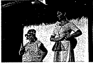
ආලෙ බැන්ද මාගේ රමාවන්